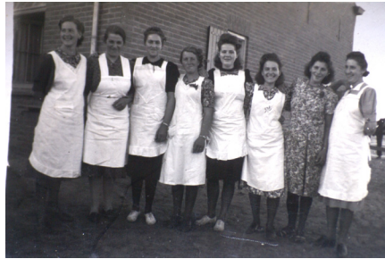
Dames met witte schorten waren helpsters. Vaak bij feestjes.