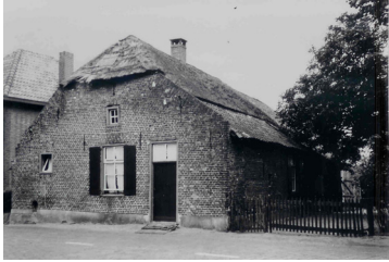
het huis van Wout de Groot. Dorpstraat 97.