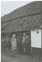
broer en zus van Gastel

Dit is het vervolg van zondag 12 februari 2023 ::