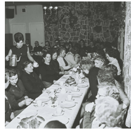
feestje in het Brouwershuis. Bediening