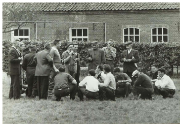
Mannen uit Leenderstrijp bij het feest van de Sint Janschool.