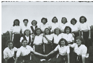
verhalen van vroeger uit Leende