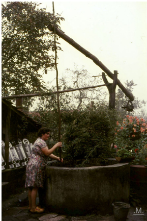
vrouw bij de put. ... van Meijl. De puttemmer en de putmik. Het was een speciale vaardigheid om de emmer op zijn kop in het water te gooien, zodat hij inderdaad onder water ging en 'vol' opgetrokken kon worden.