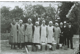
Melkcursus voor dames. Met helemaal