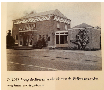
In 1958 kreeg de Boerenleenbank aan de Valkenswaardseweg haar eerste gebouw.